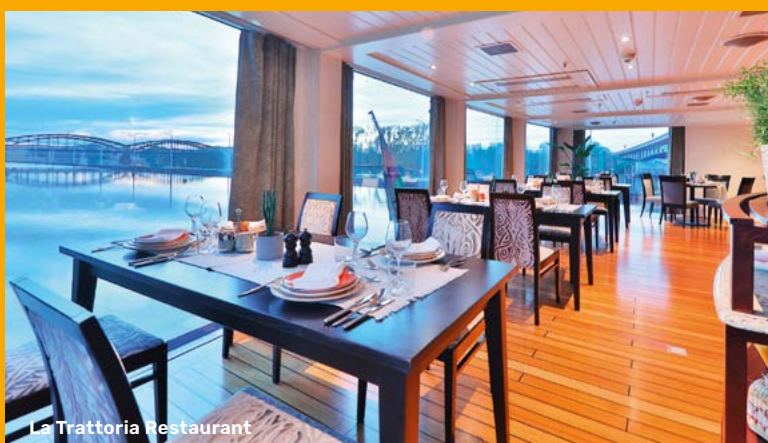
La Trattoria Restaurant