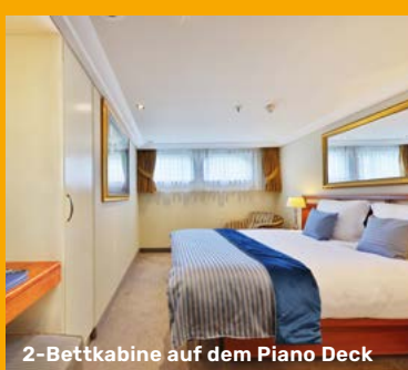
2-Bettkabine auf dem Piano Deck