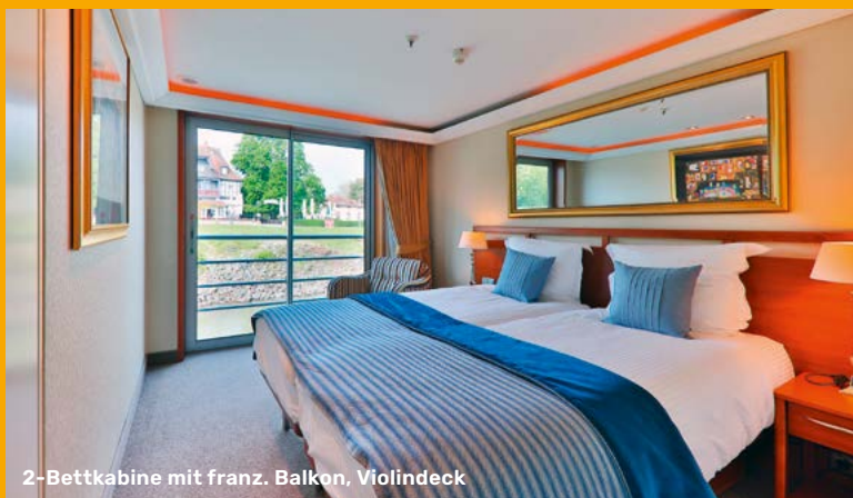
2-Bettkabine mit franz. Balkon, Violindeck