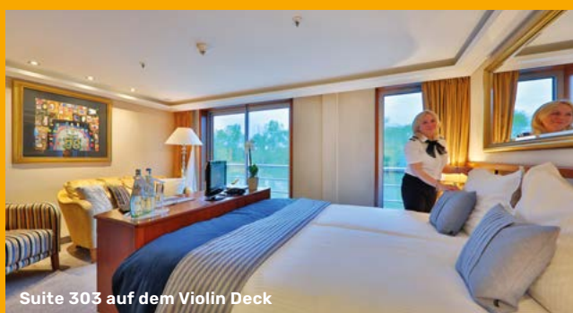
Suite 303 auf dem Violin Deck