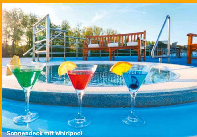
Sonnendeck mit Whirlpool